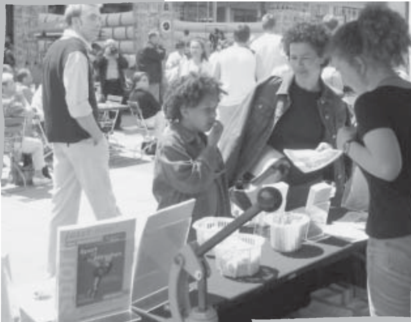
Infostand der MSJ auf dem Marienplatz

Und wer das RathausClubbing verpasst hat, hat gute Chance eine neue Gelegenheit zu bekommen, in den Räumen des Rathauses abzutanzten. Der Erfolg der Veranstaltung war so überwältigend, dass bereits über eine Neuauflage nachgedacht wird.