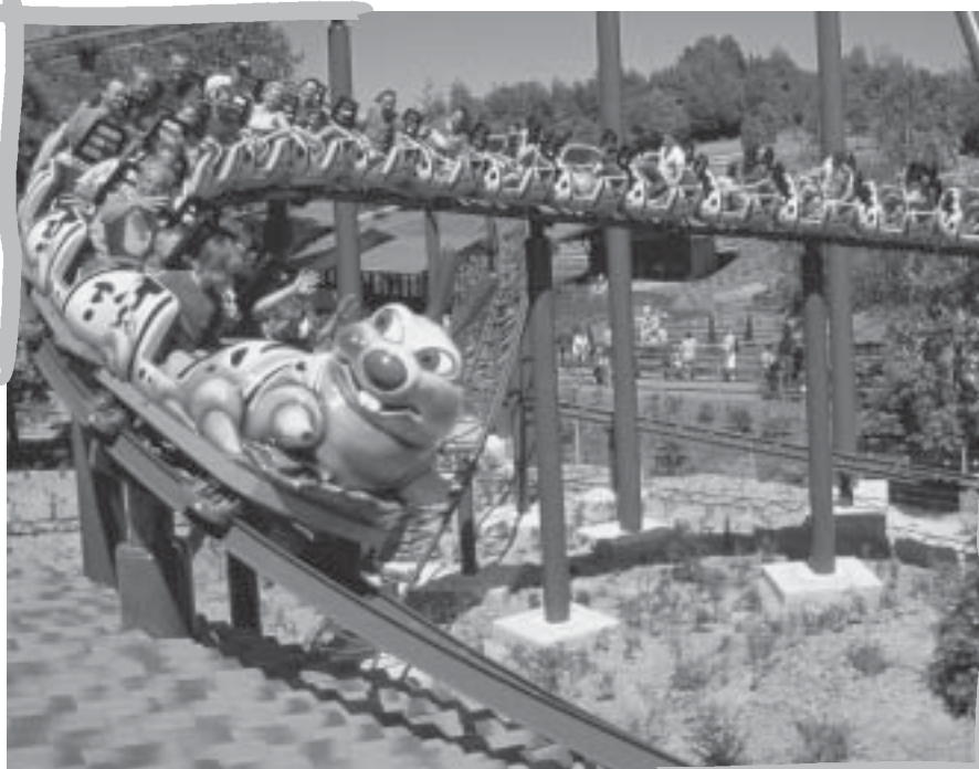
Spaß für Alt und Jung: eine Fahrt mit der Achterbahn

Zusätzliche Kosten fallen für folgende At-