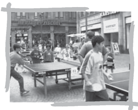
Abschlussturnier in Recklinghausen

„Tischtennis im Kampf gegen Gewalt und Rassismus“ – unter diesem Motto ist das TT-Schnuppermobil (Sponsored by Butterfly) des Deutschen Tischtennis-Bundes (DTTB) Anfang Oktober zwei Wochen lang in München unterwegs.