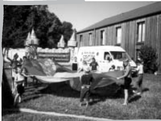
Mobiles Spiel- und Sportmaterial erleichtert ersten Schritt

Mit diesem Wissen entstand 1989 die Zusammenarbeit zwischen dem Bundesministerium des Inneren und dem Deutschen Sportbund. Sie starteten gemeinsam das Programm „Integration durch Sport“. Dieses wird bundesweit – jeweils