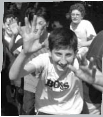
Projekt „Soziales Lernen“ an der Hauptschule an der Fromundstraße.

phase informierte sich die MSJ in einem Gespräch mit Tippelt über den aktuellen Stand der Auswertungen. Erste Ergebnisse fallen laut Tippelt sehr positiv aus und scheinen sogar noch die Erwartungen zu übertreffen.