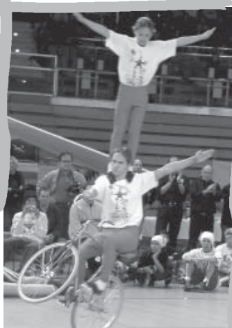
Kunstradfahrer des SV Solidarität im Showprogramm.