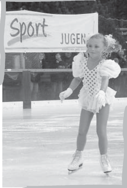
Kleine Eisprinzessin nach gelungener Kür.

Die Kinder und Jugendlichen der Münchner Eissportvereine demonstrierten den rund 2000 Besuchern, wie sicher und elegant man sich auf Eis bewegen kann. Die Eisschnellläufer des MEV eröffneten die Veranstaltung. Bei den jugendlichen EiskunstläuferInnen des MEV und des ERC ging es weniger um Geschwindigkeit als vielmehr um Eleganz und sichere Sprünge. Richtig schnell wurde es dann bei den