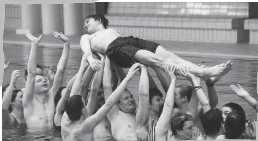
TeilnehmerInnen des Jugendleiterlehrgangs am „Fließband“

Anmeldung: Weitere Infos und Anmeldung unter Tel.: 089-157 02 206 oder per E-Mail: w.kaemmerer@msj.de