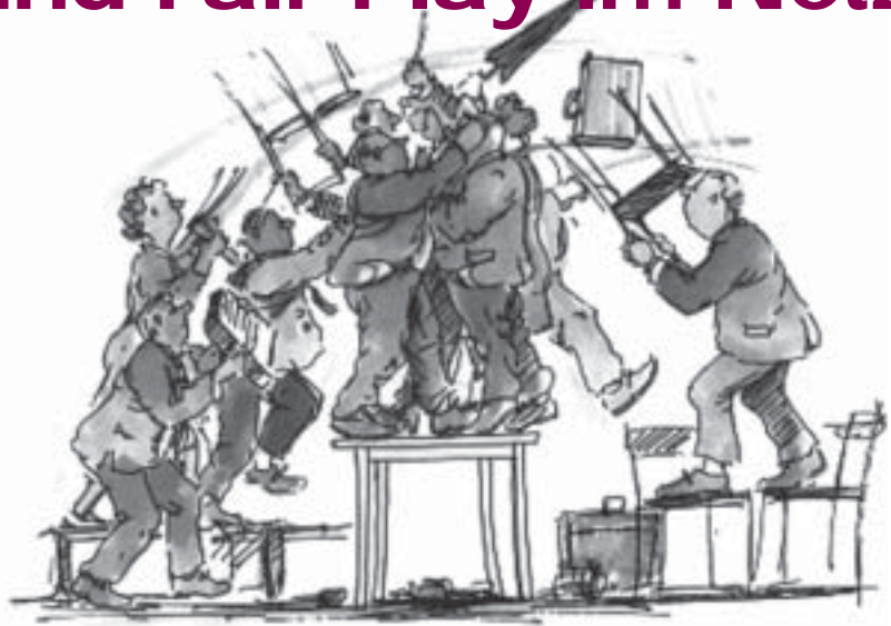
Auf dem Plakat „Streitkultur“ sind neun Stufen abgebildet, wie sich ein Streit entwickelt. Mit seinen Schulungsmaterialien will das Institut für Friedenspädagogik verhindern, dass es so weit kommt, wie auf der oben abgebildeten neunten Stufe.

E ingreifen statt zuschauen! Der Verein für Friedenspädagogik in Tübingen bietet auf seiner Homepage unter www.friedenspaedagogik.de zahlreiche Informationen und Materialien rund um die Themen Konflikte, Zivilcourage und Fair Play.