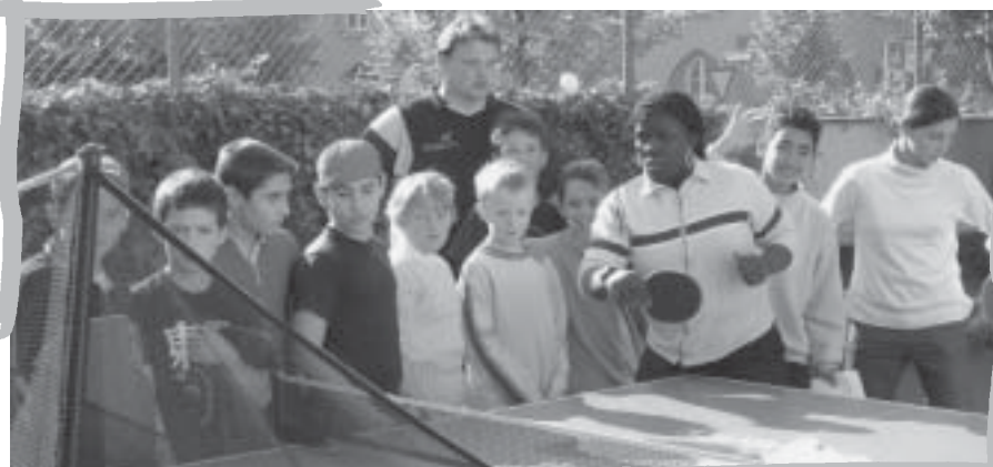
Der Tischtennis-Roboter: Ein gefragter Gegner.

Ob im Multikulturellen Jugendzentrum Westend, dem Jugendcafe Intermezzo oder dem SPAX in Pasing - das Schnuppermobil kann seine Münchentour im Rahmen der Aktion „Tischtennis gegen Gewalt und