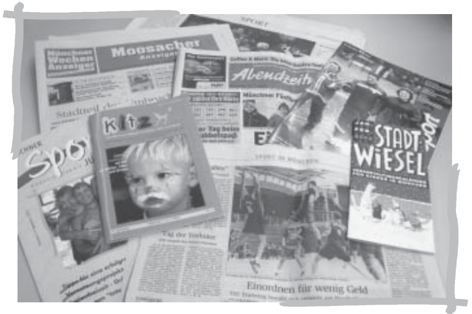
Für eine erfolgreiche Öffentlichkeitsarbeit ist die genaue Kenntnis der Medien unerlässlich.

Mitte Oktober veranstaltete die Münchner Sportjugend im Haus des Sports einen Seminarabend zum Thema Öffentlichkeitsarbeit. Eine zentrale Frage, die im Rahmen der Veranstaltung offen bleiben musste, war, woher man weiß, welches Medium sich für welches Thema interessiert.